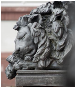
Bild 2: Löwenfigur nach Christian Daniel Rauch am Hauptportal von Schloss Philippsruhe, Foto: Detlef Sundermann.