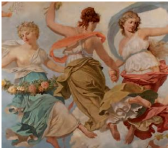
Bild 1: Ausschnitt des Deckengemäldes im Roten Saal, Schloss Philippsruhe, Beletage, Foto: Detlef Sundermann.

Bitte melden Sie sich bei nina.schneider@hanau.de oder museen@hanau.de – Wir mailen Ihnen das gewünschte Bild gerne zu.