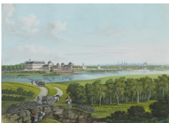
Bild 3: Blick von der südl. Mainseite zum Schloss Philippsruhe, unbekannter Maler, Aquarell, um 1800.